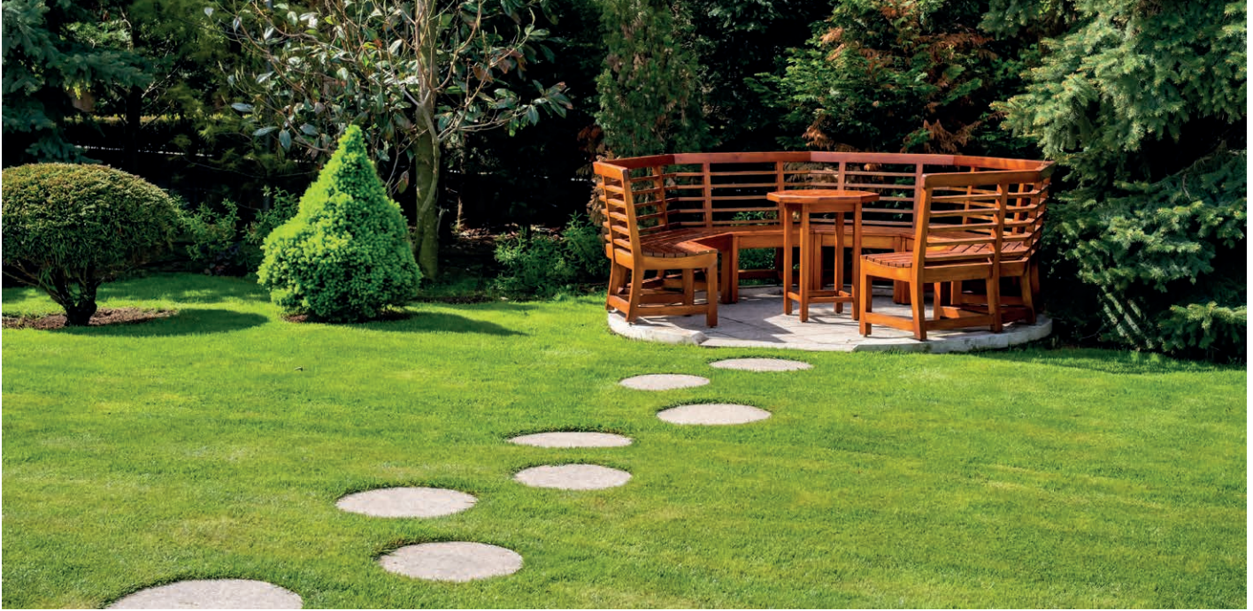
Stand: Mai 2019

Die Düngemittelhersteller verwenden für die Düngerangabe in der Regel Prozentwerte. Diese müssen auf g/m 2 umgerechnet werden.